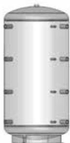
ACK 500 – 5000

* Le diamètre d'isolation ECO SKIN 100 mm faisant partie de nos livraisons standard passe à 200 mm! Le diamètre d'isolation optionnelle ECO SKIN 140 mm (uniquement pour nos modèles 800 - 1000 - 1500 litres de contenance ainsi que les accumulateurs ACK ) passe à 280 mm!