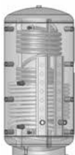
ACF 501R – 1501R

* Le diamètre d'isolation ECO SKIN 100 mm faisant partie de nos livraisons standard passe à 200 mm.