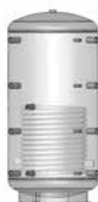
ACK 501R – 5001R