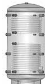
ACK 802R – 2002R