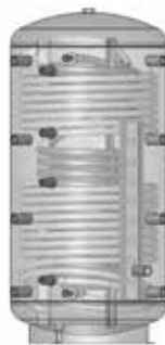
ACF 802R – 1502R