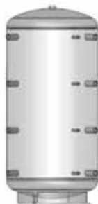
ACK 500 – 5000

* Der Durchmesser mit der im Lieferumfang enthaltenen Standard-Isolierung ECO SKIN 100mm erhöht sich um 200mm! Der Durchmesser mit der optionalen Isolierung ECO SKIN 140mm (800, 1000 oder 1500 Liter ACK-Speicher) erhöht sich um 280mm!