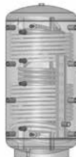
ACF 802R – 1502R