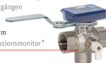
AQA Therm HSS Korrosionsmonitor*

Frühwarnsystem zur Erkennung von Korrosionsvorgängen