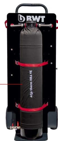
AQA Therm HRA VE*

Reinigung und Entsalzung des Wassers von Heizungsanlagen im Betrieb