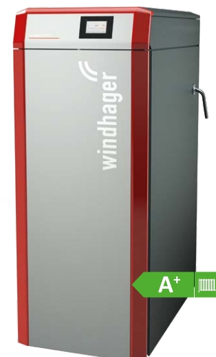
LogWIN Premium 1/2m-Holzvergaserkessel mit Edelstahl-Füllraum 13 bis 50 kW