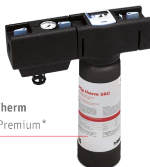
AQA Therm HWG Premium*

Heizungswassergruppe für eine normgerechte Nachfüllung