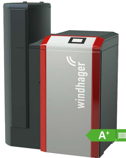
BioWIN2 Vollautomatischer Pellets- Zentralheizungskessel 3 bis 63 kW, Kaskade: 3 bis 252 kW