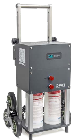
AQA Therm Move Power*

Salzarmes Heizungswasser ohne Zusatzstoffe