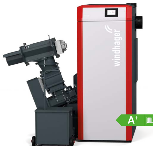
PuroWIN Hackgutvergaser mit direkter oder pneumatischer Raumaustragung 7 bis 100 kW, Kaskade: 7 bis 400 kW