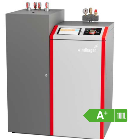
BioWIN Ultegra Plug & Heat - einfach und bequem mit dem myComfort System 4 bis 18 kW